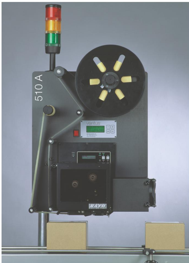
Ventus 510 A

Этот тип аппликатора идеально подходит для высокоскоростных производственных линий, где нанесение этикетки должно происходить максимально быстро. Кроме того, этот тип аппликатора так же хорошо подходит для жесткой и грубой поверхности продукции, как и для продукции, которой нельзя касаться. Максимальная скорость нанесения этикеток - 100 этикеток/мин, (размер этикетки 25 x 30 мм). При нанесении большого количества этикеток одного размера производительность Ventus 510A увеличивается.