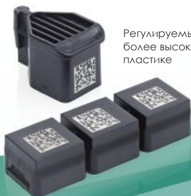
Регулируемый сигнал для более высокой контрастности на пластике

Благодаря оптимизированному зеркалу и программному обеспечению i-Tech сканирования можно объединить точность и высокие скорости производственных линий. Таким образом, F220i идеален для применения в («маркировке на лету»).